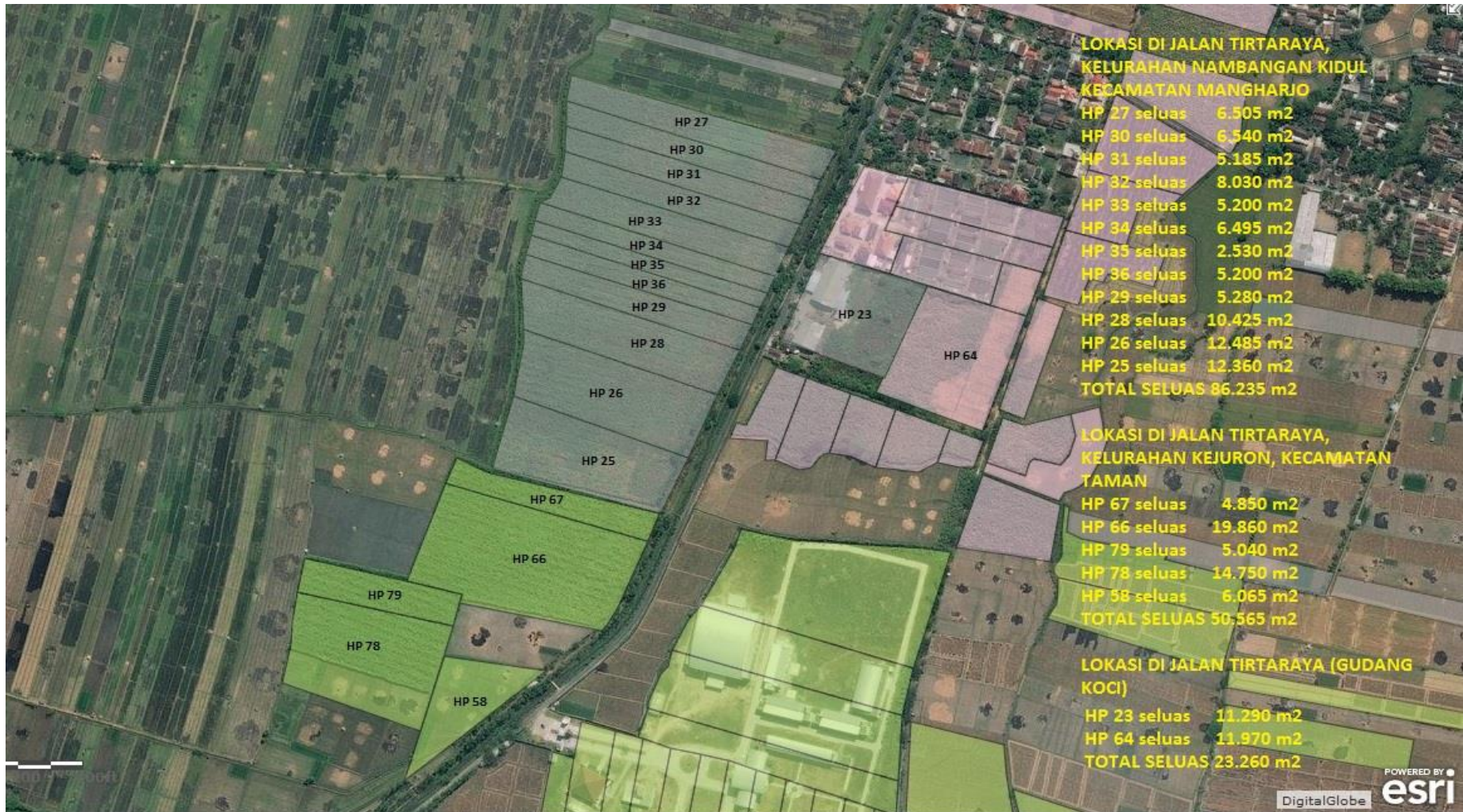
Gambar 4.3 Peta Lokasi PecelLand