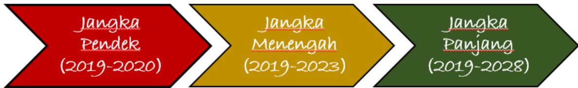
Gambar 4.1 Roadmap Implementasi Program Pembangunan Jangka Pendek: PeceLand

Roadmap atau peta jalan pembangunan Smart City Kota Madiun dimulai dari dimensi utama yang menjadi fokus dalam pembangunan Smart City . Pembangunan Smart City Kota Madiun berdasarkan dimulai berdasarkan roadmap jangka pendek (1 tahun), jangka menengah (5 tahun), dan jangka panjang (10 tahun) seperti pada gambar di bawah ini.