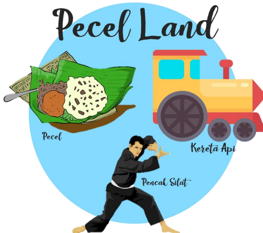
Gambar 4.2 PeceLand: Quick Win Smart City Kota Madiun

dikembangkan dengan 3 ikon tersebut yaitu: Pecel, Pencak Silat, dan Kereta Api yang digambarkan seperti pada Gambar 4.2.